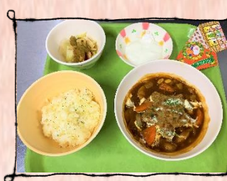
クリスマス星型ハンバーグ