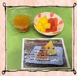
季節のフルーツスイカ